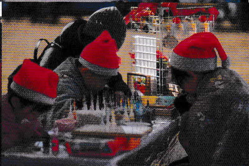
※12月クリスマスマーケット時の写真となります