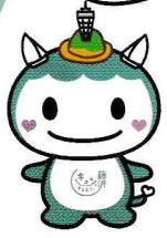
「キュンとするまち。藤沢」 公式マスコットキャラクター ふじキュン♡